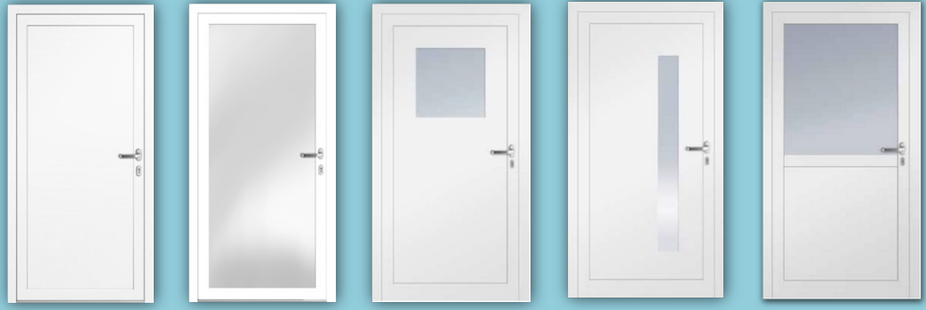
Panel Glas Füllung mit Glas Füllung mit Glas Panel / Glas Mindestmaß = 940mm

(Nur in bestimmten Ausführungsvarianten und Zusatzausstattungen möglich.)