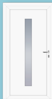
Füllung mit Glas