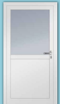
Panel / Glas