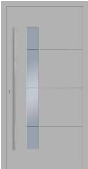
JT4 Ansicht B mit Lisene flächenbündig außen Haustür Motivglas W3