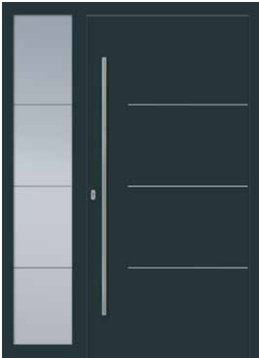
JT1 Ansicht B mit Lisene flächenbündig außen Seitenteil Motivglas W3