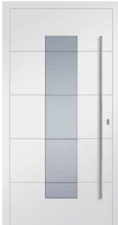
JT2 mit Nuten außen Haustür Motivglas W4