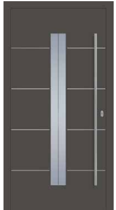
JT3 mit Lisene flächenbündig außen Haustür Motivglas S1