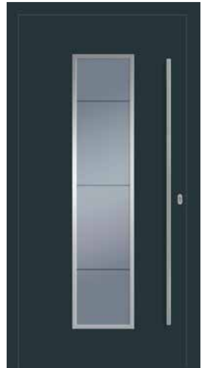
JT6 mit Rahmen flächenbündig außen Haustür Motivglas W3